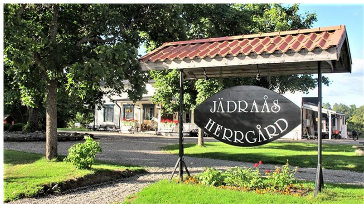
Klicka på bilden

Turen är inte markerad i terrängen. Skriv ut kartan och ha den med dig på färden! Om du har en app med gps-funktion nedladdad i din mobil, t.ex. Topo-Gps , ser du hela tiden var du befinner dig på kartan.