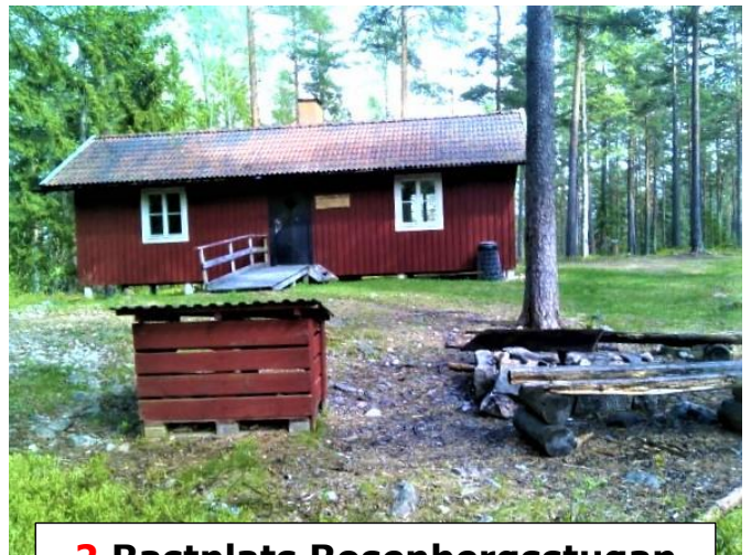
2 Rastplats Rosenbergsstugan