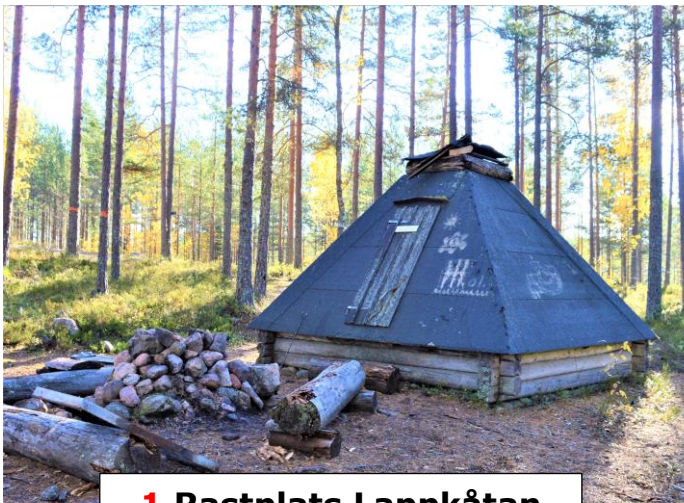
1 Rastplats Lappkåtan

Den östra delen av turen går på asfaltväg. I övrigt är det grusvägar. Den är inte markerad i terrängen. Skriv ut kartan och ha den med dig under turen! Om du har en app med gps-funktion nedladdad i din mobil, t.ex. Topo-Gps , ser du hela tiden var du befinner dig på kartan.