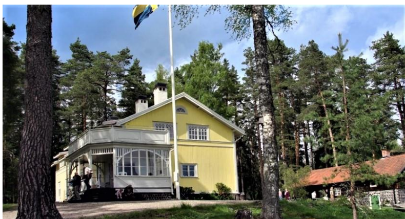
Tallbo. Klicka på bilden