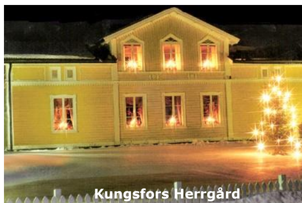
Klicka på bilden