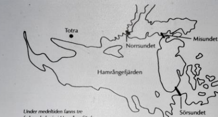
Under medeltiden fanns tre farbara leder in i Hamrångefjärden.

till omgivande mark. Det kan bero på att området omgärdats av en "förborg" bestående av en låg stenmur och ovanpå den en timmerpalissad. Spår av en stenmur kan ses längs västra sidan av husgrundsområdet.