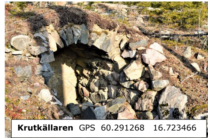
Krutkällaren GPS 60.291268 16.723466

Av säkerhetsskäl placerades den en bit från gruvhålen men även av praktiska då det på den här platsen är torrt.