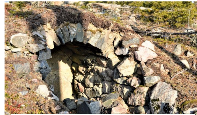
Krutkällaren GPS 60.291268 16.723466

Av säkerhetsskäl placerades den en bit från gruvhålen men även av praktiska då det på den här platsen är torrt.