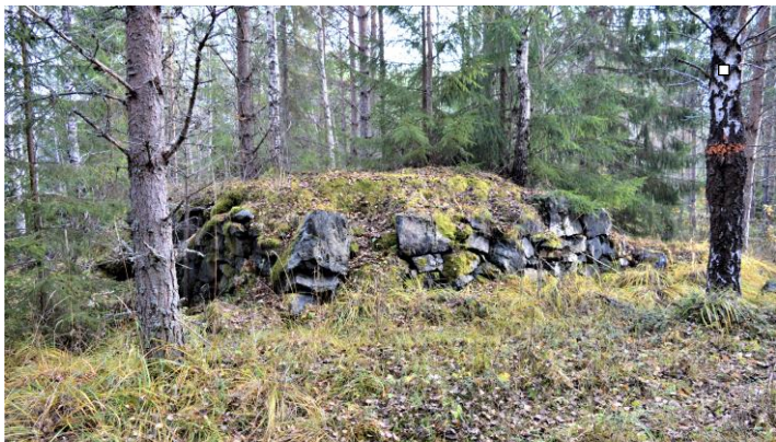
Rödängs gruvor GPS 60.297148 16.677761